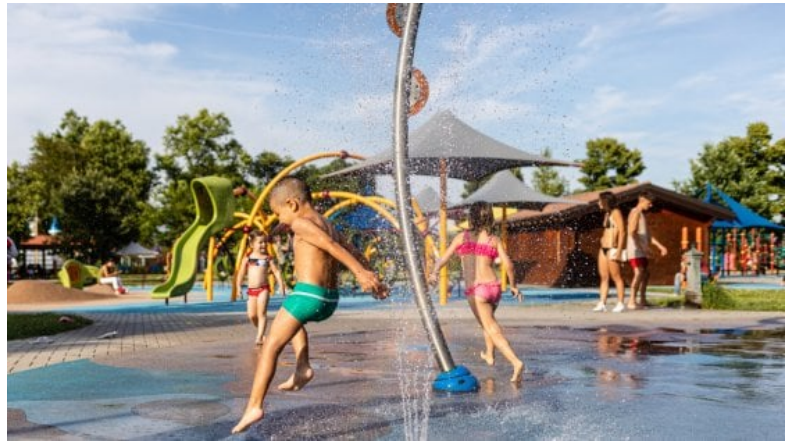
Idroscalo, villaggio dei bambini.

Campi estivi fino a settembre all'insegna dello sport e tanti laboratori didattico-educativi: coinvolti 2.300 bambini